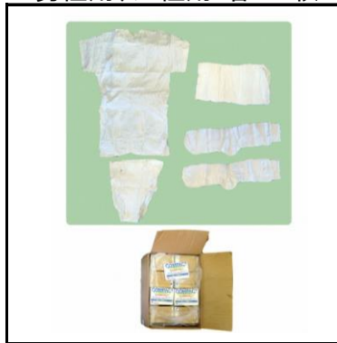
コンパクト肌着セット 男性用、女性用:各300枚