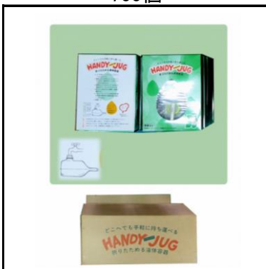
折りたたみポリ容器(5ℓ) 700個