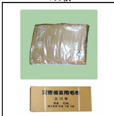
毛布(真空パック) 700枚