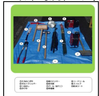
* 救助用資機材 スコップ、つるはし、バール等