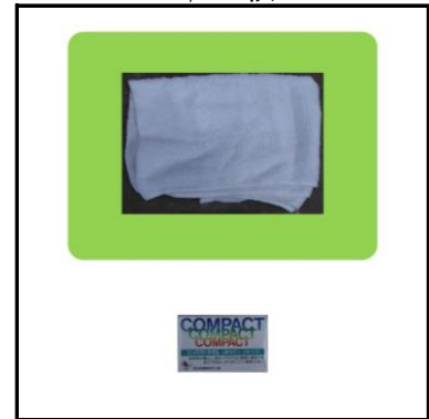
コンパクトタオル 1,500枚