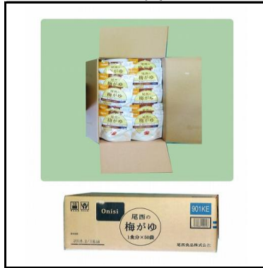
梅かゆ(パック入り) 750食