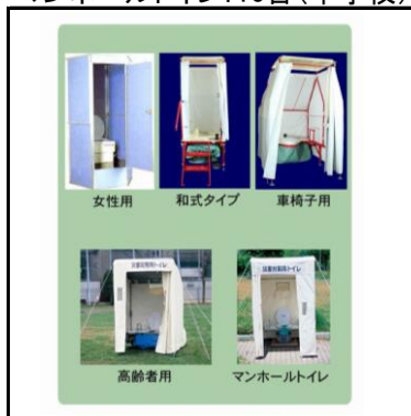
簡易トイレ:7台 マンホールトイレ:10台(中学校)