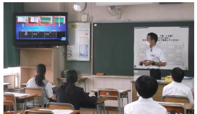
技術の時間は、テレビ画面を使ったスライドでの学習でした。