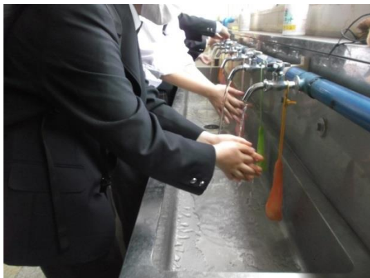
帰る際は、必ず手洗いをしています。 帰宅後も行いましょう。