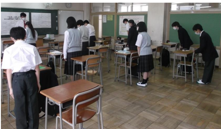
学習の始めと終わりは、挨拶をしています。