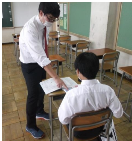
質問のある生徒は居残りをして、担当教科の先生に個別指導をしてもらいました。