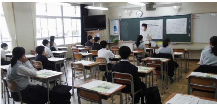
しっかりと先生の話聞いています。

新型コロナウイルス感染の広がりが、かなり抑えられています。しかしながら、まだまだ気を緩めることなく、外出自粛や手洗いうがい等の生活習慣を心がけ、健康な状態を保つことに努めましょう。