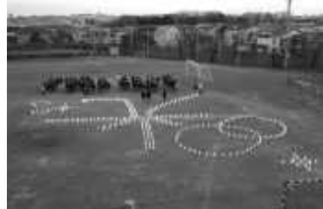
(上) 燈花会準備中 (下) 浮かび上がった「光」の文字