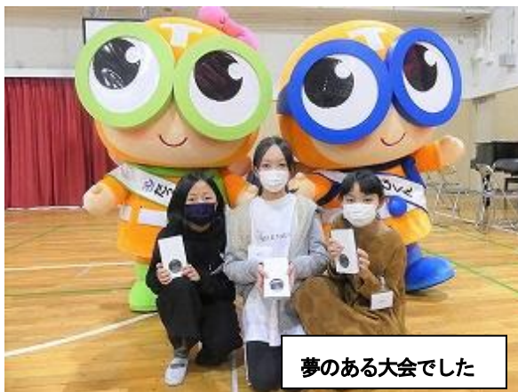
夢のある大会でした

新型コロナ対応にともない、学校行事の変更や様々な規制に、ご家庭、地域の皆様には、ご理解ご協力いただきましたことに感謝いたします。そして、ともかく、一日も早くコロナ禍が治まり、子どもたちにも、皆様にも、穏やかに良き年が訪れることをご祈念申し上げ、一年を終わりたいと思います。