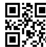
配信停止用QRコード

立川市 ( tc-aa@city.tachikawa.lg.jp ) から届くメールに記載されているURLにアクセスします。 登録を削除する を押し、削除完了メールが届きましたら完了です。