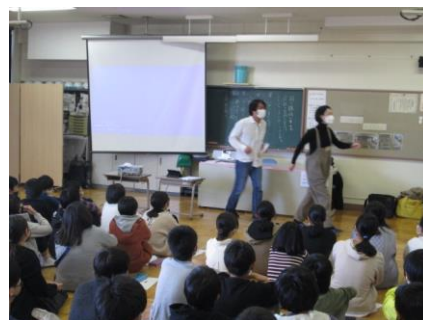
6年 創作劇活動 (たちかわ創造舎のご協力)