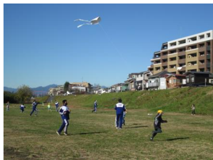
1年 小中連携たこあげ