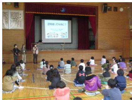
4年 認知症サポーター養成講座