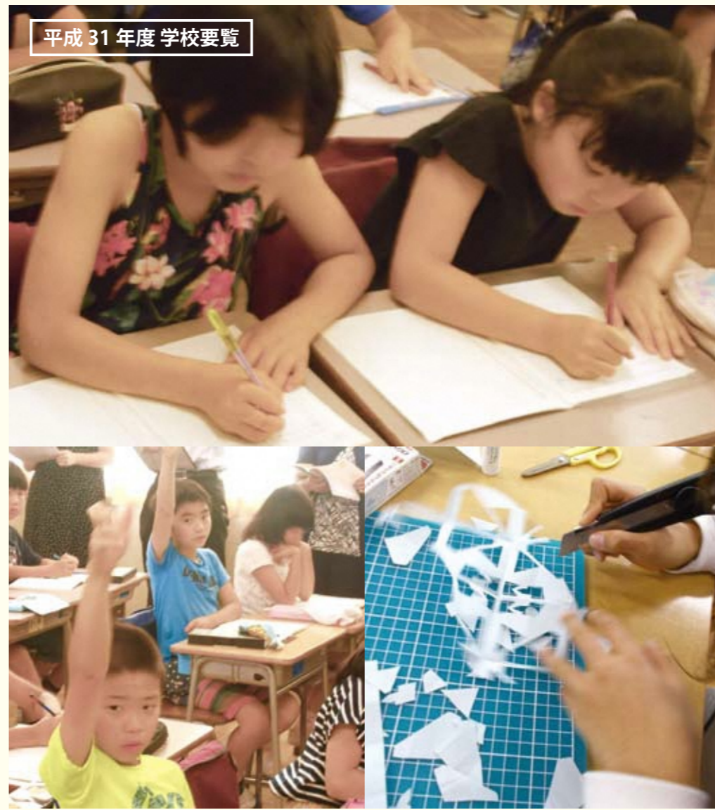
平成 31 年度 学校要覧