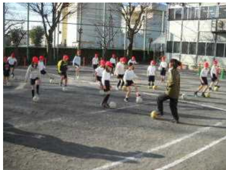
1/16・18・21 オリンピアンによるサッカー教室