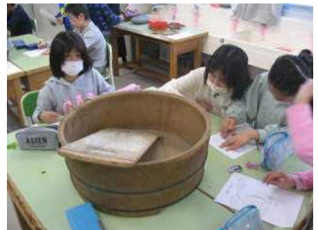
1/24 3年 社会科出前授業

子どもたちの活動の様子はホームページ( http://www.tachikawa.ed.jp/es13 )に掲載しております。ぜひご覧ください。