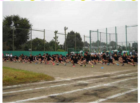
5・6年 舞～from 南砂ソーラン to 夏疾風～

子どもたちの活動の様子はホームページ( http://www.tachikawa.ed.jp/es13 )に掲載しております。ぜひご覧ください。