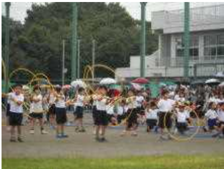
1・2年 イッツ ア みなみすな ①ーールド!