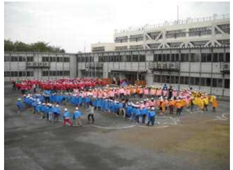
4/24 創立50周年行事航空写真撮影

子どもたちの様子等をホームページ( http://www.tachikawa.ed.jp/es13 )に掲載しております。ぜひご覧ください。