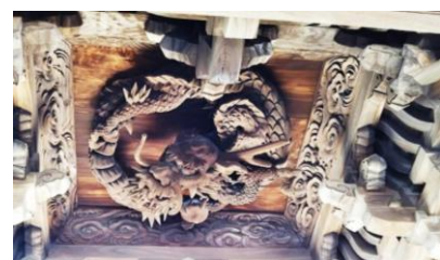
引接寺の山門の龍

それから三年の時が過ぎ、今年5月20日(水)、同じ下関のお寺「引接寺(いんじょうじ)」に引き取られることとなりました。この「引接寺」は1560年に開かれた由緒あるお寺であり、山門には龍が力強く彫られている”龍”に深く縁のあるお寺です。それだけでもありがたい「 ご縁 」を感じるのですが、更に歴史を調べてみると、興味深い繋がりが見えてきました。