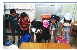
校長室にあいさつ

道徳の授業で挨拶の大切さを学んだ子どもたちが、その授業をきっかけに校長室や職員室にわざわざ立ち寄り、このように心のこもった挨拶をしてくれます。道徳の授業を通して、普段の生活に生かしている、この子どもたちの行動は、われわれ教師として最高の喜びでもあり、癒やされる瞬間です。