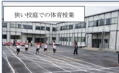
狭い校庭での体育授業