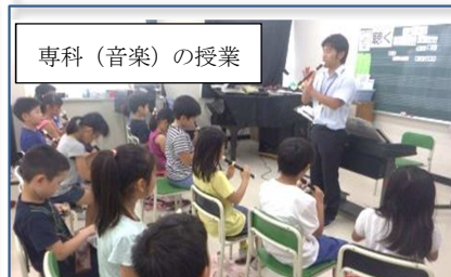
専科 (音楽) の授業

プレハブでできているとはいえ、きれいに仕上がった校舎に移転した時は、子どもたちだけではなく我々教職員も、わくわくしていました。明らかに本校舎より良くなったのはトイレでした。24時間換気システムで臭いを気にすることもなく快適でした。また、必要最小限の教室配置は、安全面で各教室を巡回する教職員にとっても、また教室移動する児童にとっても便利でした。仮設校舎に生活し始めた時は、このまま仮設校舎でもいいかなと真剣に思ったほどです。しかし、時が過ぎ、次第に床が擦れ、子どもたちの歩く振動が気になってくると、本校舎への引っ越しも待ち遠しくなってきたのも事実です。仮設校舎での子どもたちの生活の様子、この写真から少しでも伝われば幸いです。