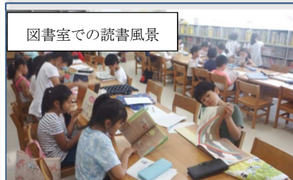
図書室での読書風景