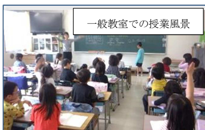
一般教室での授業風景