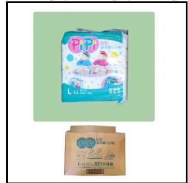
紙おむつ 子供用 S:256枚、M:240枚、L:624枚