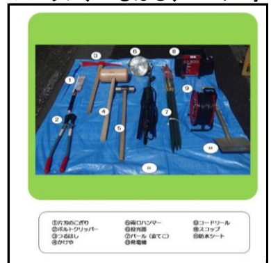
* 救助用資機材 スコップ、つるはし、バール等