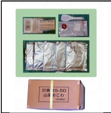
アルファ化米(山菜・五目) 3,800食