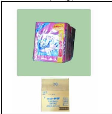
生理用ナプキン 14,112枚