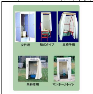
簡易トイレ:7台 マンホールトイレ:10台(中学校)