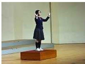
最後に全員で「校歌斉唱」