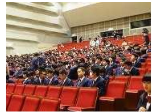
自分の席に着きます