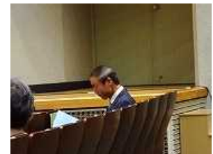
田口先生がご来場！