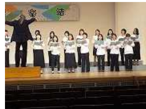
曲は「たしかなこと」「Let it Go～ありのままに～」