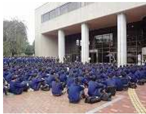
入り口前に集合して