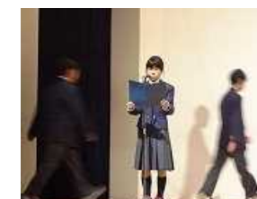
2組「この地球のどこかで」