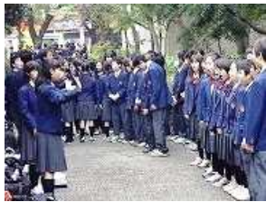
1・2年が外で朝練習