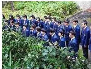
雨が降らなくて良かった