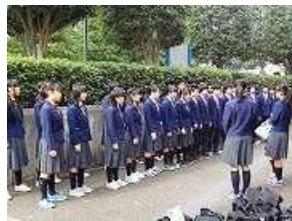
3年は気合いを入れて最後の練習