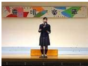
実行委員が開会の言葉