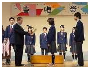
どのクラスも甲乙付けがたい出来でした