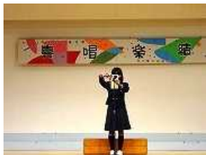
審査結果の封筒を開ける