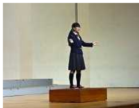
曲目は「明日の空へ」