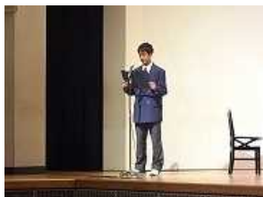
4組「地球星歌～笑顔のために～」