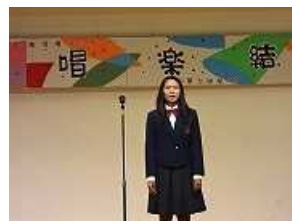
実行委員長の締め言葉