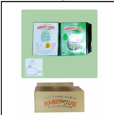
折りたたみポリ容器(5ℓ) 700個