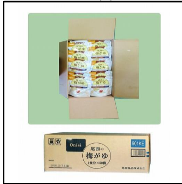
梅かゆ(パック入り) 750食