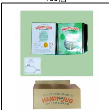
折りたたみポリ容器(5ℓ) 700個