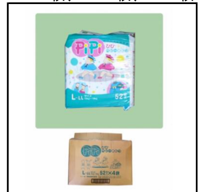
紙おむつ 子供用 S:256枚、M:240枚、L:624枚