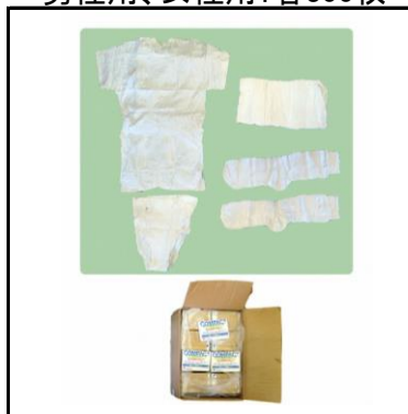
コンパクト肌着セット 男性用、女性用:各300枚