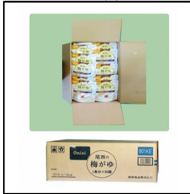
梅かゆ(パック入り) 750食