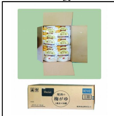
梅かゆ(パック入り) 750食