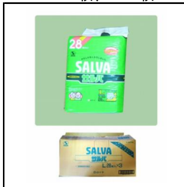
紙おむつ 大人用 M:180枚、L:168枚