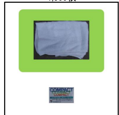
コンパクトタオル 1,500枚