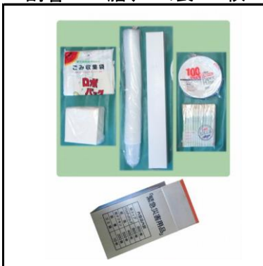
コップ:1,400個 紙皿:400個 割箸:200膳、ゴミ袋:10枚