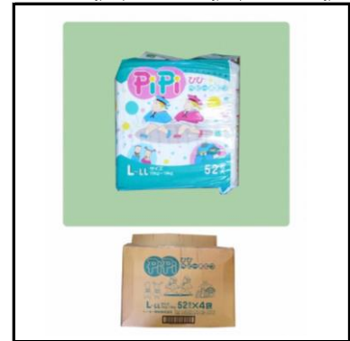
紙おむつ 子供用 S:256枚、M:240枚、L:624枚