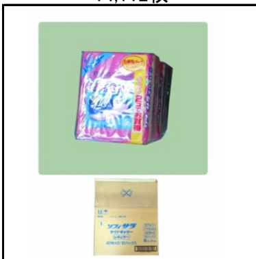
生理用ナプキン 14,112枚