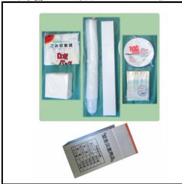
コップ:1,400個 紙皿:400個 割箸:200膳、ゴミ袋:10枚