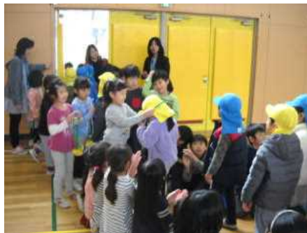
2/23 新入学児童学校見学(1年)