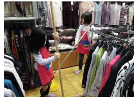
2/23 9才のハロウワー(3年)

子どもたちの活動の様子はホームページ( http://www.tachikawa.ed.jp/es13 )に掲載しております。ぜひご覧ください。