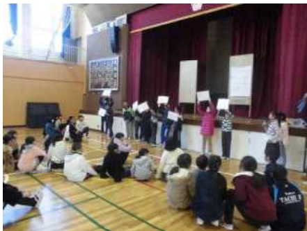
2/6 立川ろう学校交流(5年)