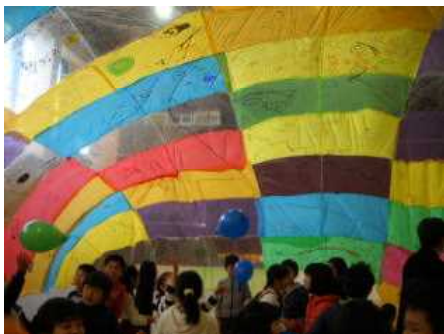
12/18 芸術家による授業(4年)