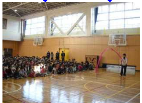
12/20 オリンピック講演会・実技教室