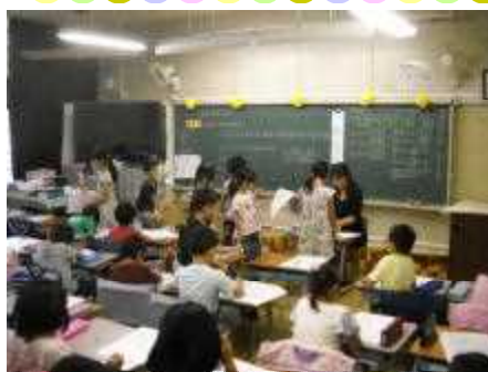
9/12 チャレンジタイム