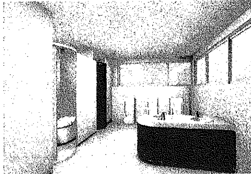
▲改修後の児童男子トイレ